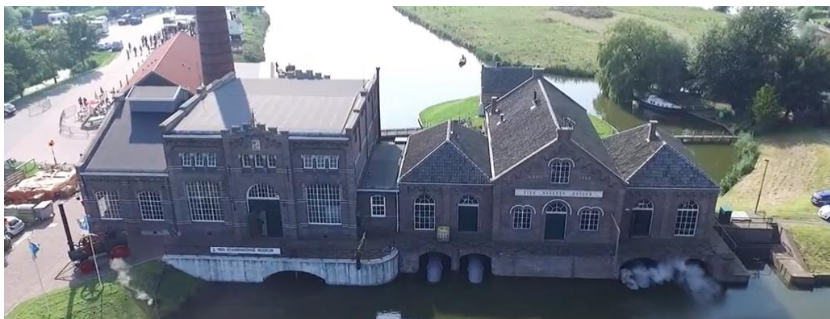
Foto van Het Nederlands Stoommachine Museum in Medemblik, waar de Algemene Leden Vergadering is gehouden. In het gebouw waarvan het dak zichtbaar is achter de schoorsteen, werd het vergaderdeel gehouden en gegeten en gedronken. Onderdeel van het programma van de ALV was een bezoek aan het museum.