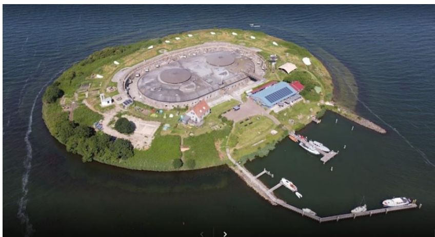
Afbeelding van het eiland Pampus

Er is bij de ingang van de haven ruim voldoende parkeergelegenheid op het parkeerterrein van 'De Trekvogel'.