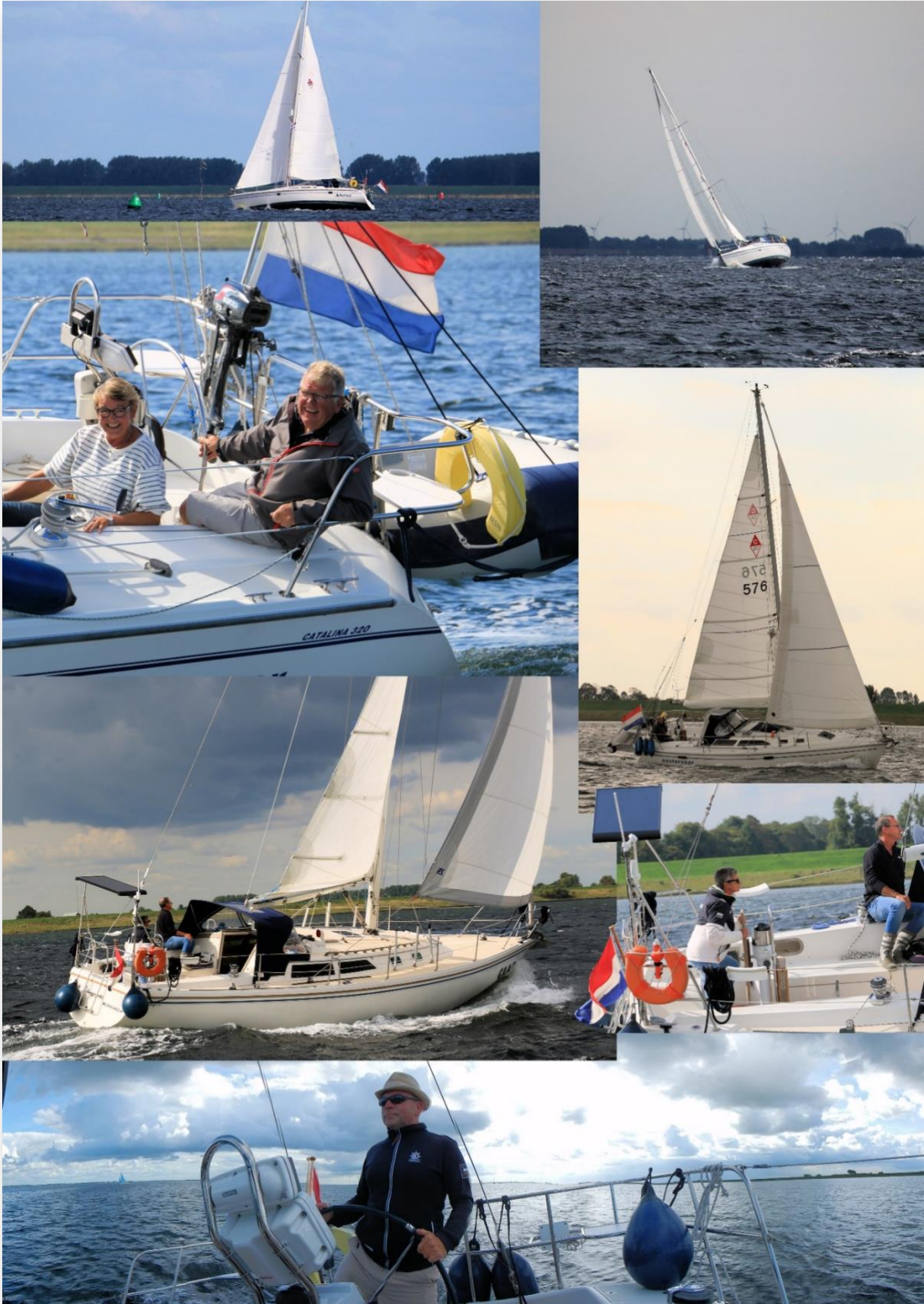
Nieuwsbrief no. 37